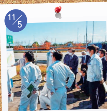
11/5 自民党県連政調会 呉西ブロック現場視察。