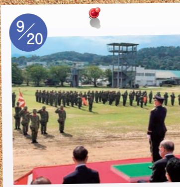
9/20 陸上自衛隊金沢駐屯地 創立70周年記念行事を見学。