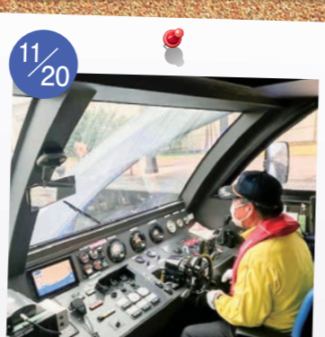
11/20 委員会の行政視察。 富岩水上ラインと 富山県発電制御所を見学。