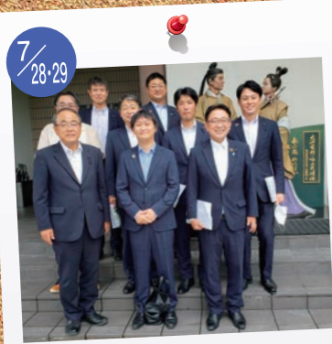
7/28-29 富山県議会自民党議員会 「令和の会」研修会。 地元の伏木地区で開催。