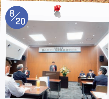
8/20 富山県河川海岸協会および 富山県治水砂防協会の 令和2年度通常総会に富山県議会 議長の代理として出席。