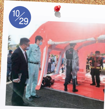
10/29 砺波市内で行われた 令和2年度 富山県国民保護 共同実動訓練。