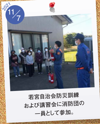
2021 11/7 若宮自治会防災訓練 および講習会に消防団の 一員として参加。