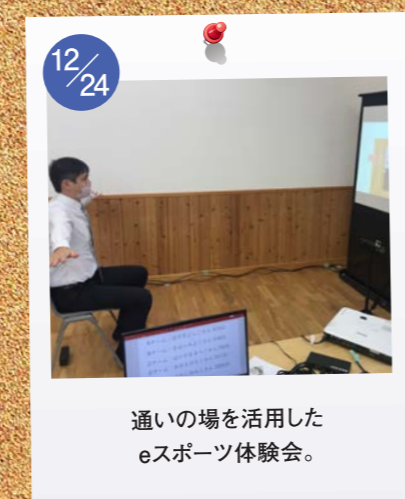
12/24 通いの場を活用した eスポーツ体験会。