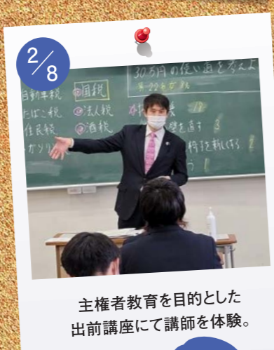
2/8 主権者教育を目的とした 出前講座にて講師を体験。