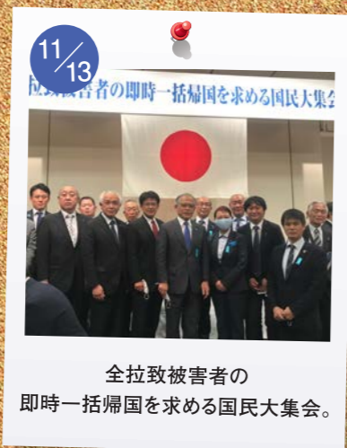
11/13 全拉致被害者の 即時一括帰国を求める国民大集会。