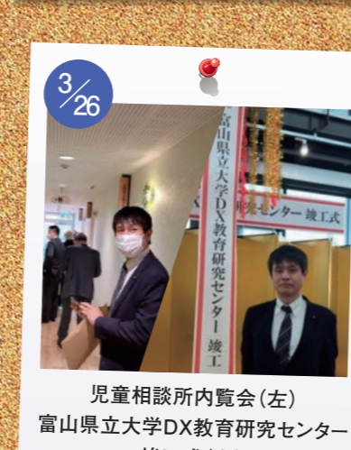
3/26 児童相談所内覧会(左) 富山県立大学DX教育研究センター 竣工式(右)