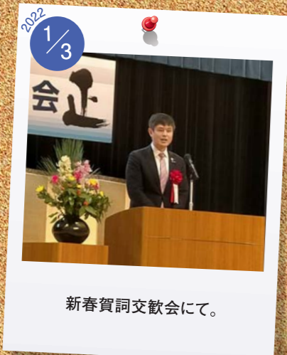
2022 1/3 新春賀詞交歓会にて。